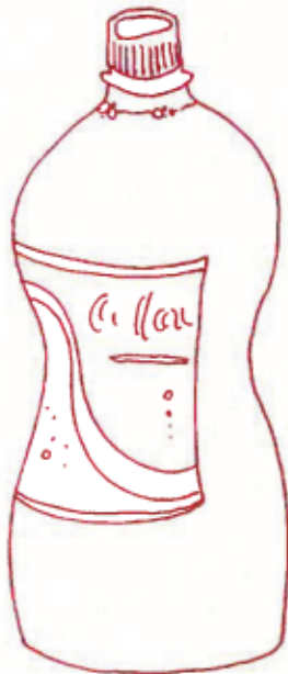
Flasche Cola (1l)